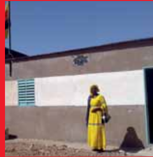
Sanierung der sanitären Anlage einer Schule