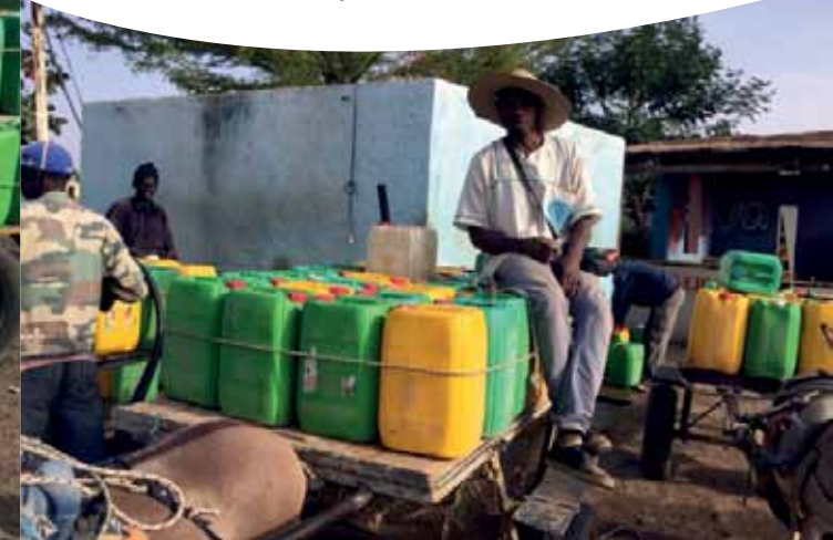
Maroder Brunnen in Bambey

Mit Unterstützung der Deutschen Bundesstiftung Umwelt (DBU) mit Sitz in Osnabrück sowie der Niedersächsischen Bingo-Umweltstiftung wird in Bambey ein maroder Brunnen saniert und mit einer Solaranlage ausgestattet. Damit sind die Bewohner eines Stadtteils von Bambey zukünftig mit sauberem Trinkwasser versorgt. Das ist eine grundlegende Voraussetzung für die Gesundheit aller Menschen, besonders der Kinder. Der Caritasverband Senegal koordiniert vor Ort die Arbeiten am Brunnen.