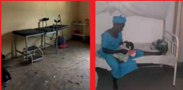
Sanierung der Entbindungsstation